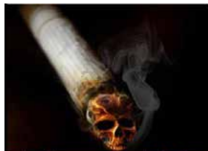
Smoking causes early death