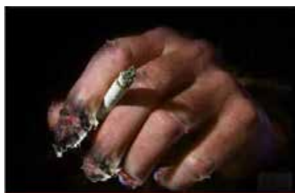
Smoking increases risk of more than 25 diseases including cancer and cardiovascular disease