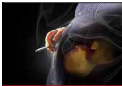
Passive smoking affects fetus and leads to growth retardation and premature labor