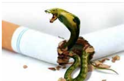
Cigarettes contain more than 4000 toxic substances and causes death